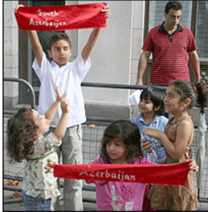
دولتمردان ایران تاکنون مشخص نکرده اند که چرا با وجود عدم منع قانونی، غیرفارسی زبانان امکان فراگیری زبان و ادبیات مادری خود را در مدارس ندارند

Ünvan: Azərbaycan, Bakı, Şərifzadə 1, Ayna; Tel/Faks +47-99399225; Email: dunazhak@hotmail.com Address: Ayna, Sherifzade 1, Baki, Azerbaijan; Tel/Fax +47-99399225; Email: dunazhak@hotmail.com