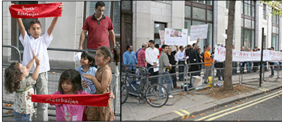
Southern Azerbaijanis demonstrating in front of Bush House, BBC

However, due to a good planning, the BBC reported the protest in London with detailed background information and an interview with a Southern Azerbaijani activist – please refer to Clips xx.